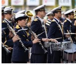
Musique de l'Air et de l'Espace de Bordeaux