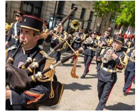
Fanfare de la 9e BIMA