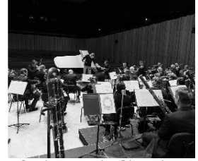
Orchestre de Chambre Nouvelle-Aquitaine