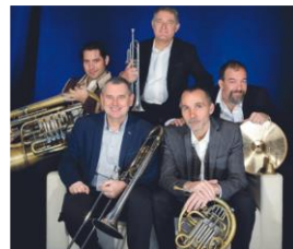
Odysée ensemble & Cie